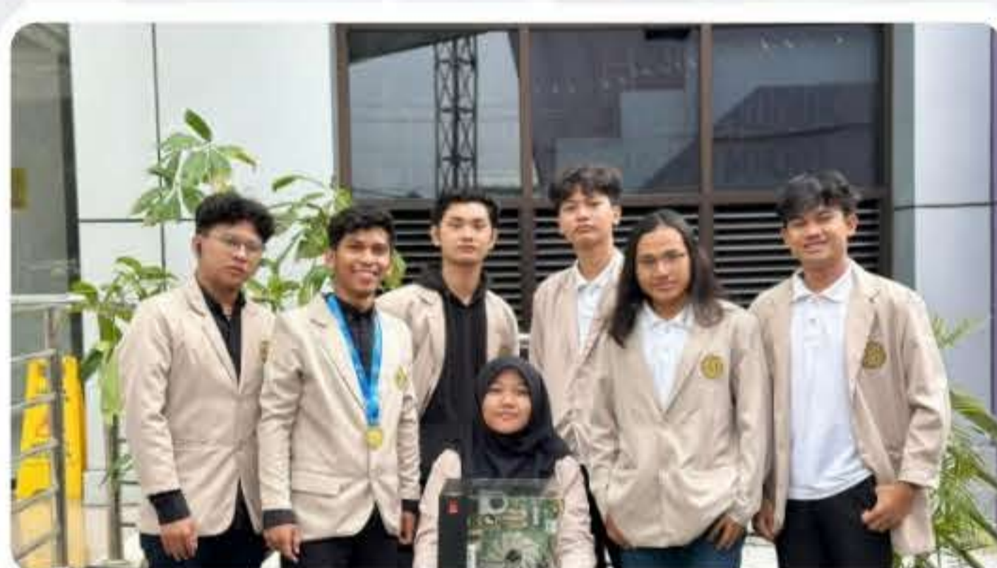
Mahasiswa Universitas AMIKOM Yogyakarta yang tergabung dalam IEEE Universitas AMIKOM Yogyakarta Student Branch berhasil meraih hibah internasional tertinggi IEEE TryEngineering STEM Grant 2025, dalam kategori Inspire Level senilai USD 2,000.