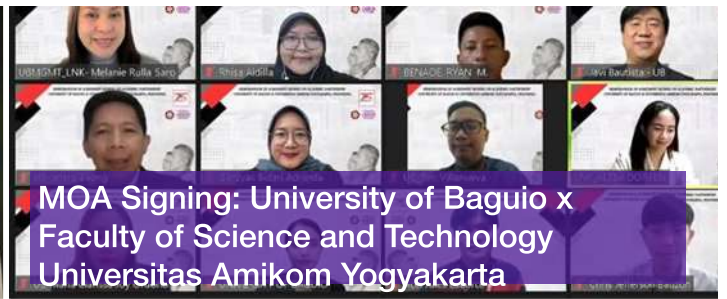
MOA Signing: University of Baguio x Faculty of Science and Technology Universitas Amikom Yogyakarta