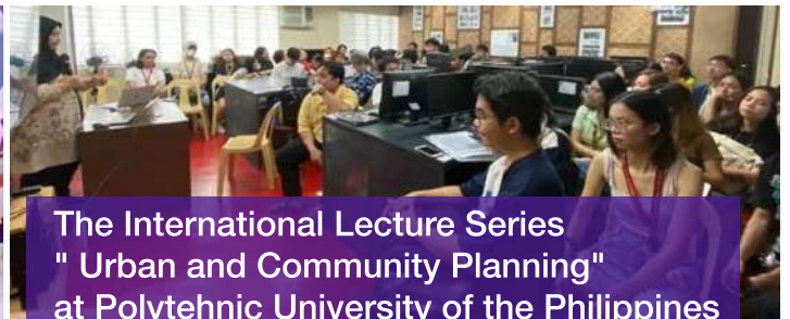
The International Lecture Series "Urban and Community Planning" at Polytechnic University of the Philippines