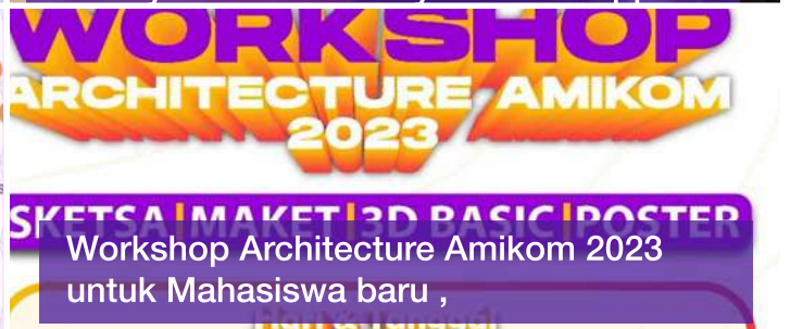
Workshop Architecture Amikom 2023 untuk Mahasiswa baru ,