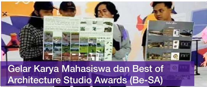
Gelar Karya Mahasiswa dan Best of Architecture Studio Awards (Be-SA)