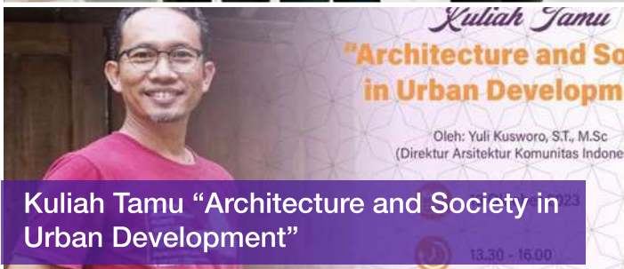
Kuliah Tamu "Architecture and Society in Urban Development"